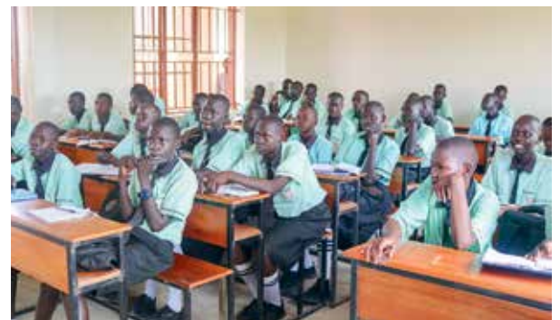
In den neuen, helleren Klassenräumen macht das Lernen viel mehr Spaß.

Ein großes „Dankeschön“ an unsere vielen Unterstützer*innen, welche es uns ermöglicht haben, für die St. Vincent Gemeinschaft in Juba eine wunderschöne neue Grundschule zu bauen. Mit Ihrer Hilfe konnten acht neue Klassenräume auf zwei Etagen entstehen! Danke! Ein Meilenstein in der Geschichte der Schule und eine riesige Verbesserung der Lernbedingungen: Statt fast 100 Schüler*innen pro Klassenzimmer konnten die Klassen nun geteilt werden, wodurch sich nur noch max. 50 Schüler*innen einen Raum teilen. Dieses Jahr werden wir die Grundschule noch mit einer Solaranlage vervollständigen, damit auch die Stromversorgung sichergestellt ist und dem Lernen wirklich nichts mehr im Weg stehen kann.