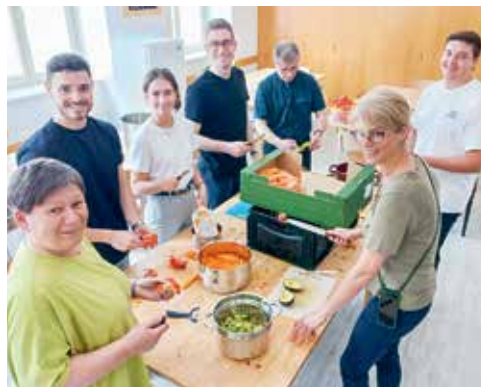
Beim Kochen entsteht Gemeinschaft.

Einrichtungen unterstützen. Das Sommerfest im Haus Amadou war mehr als nur ein Fest, es war ein Symbol der Solidarität und des Miteinanders. ■