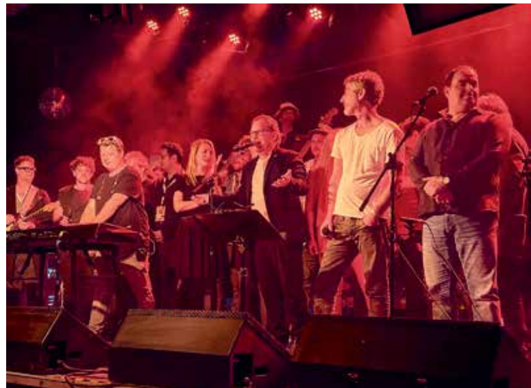
Die Stimmung beim Benefizkonzert im Grazer ppc war großartig. Danke an alle Beteiligten für den gelungenen Abend!

Die Caritas Steiermark verzeichnet einen Anstieg von fast 50 Prozent bei Beratungen in Notlagen. Die Raiffeisen Steiermark reagierte darauf mit einer besonderen Aktion: Im Winter wurden alle Transaktionen der Raiffeisen-Kund*innen mit drei Eurocent pro Vorgang honoriert. Diese Gelder flossen in den „Wir hilft“-Fonds. Rund 240.000 Euro zahlte die Raiffeisenbank in diesen Fonds ein, ergänzt durch Spenden von der Bevölkerung und Raiffeisen-Mitarbeiter*innen. Insgesamt wurden so mehr als 600.000 Euro gesammelt, davon 75.000 Euro für die „WIR hilft - Unwetterhilfe“ im Sommer 2023. Ein großes Danke dafür!