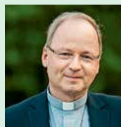
Ihr Bischof Benno Elbs

Ich danke Ihnen von Herzen für Ihr Engagement und Ihre Unterstützung!