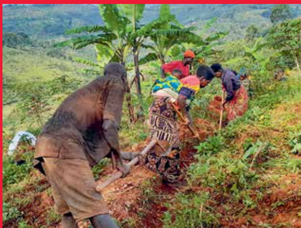
Teilnehmer*innen beim Ausheben eines Erosionsschutzgrabenes.

All diese Maßnahmen stärken die Resilienz der kleinbäuerlichen Familien und fördern nachhaltigen Umgang mit natürlichen Ressourcen in Burundi. ■